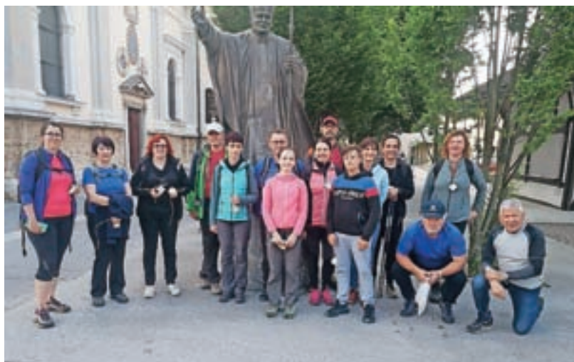
Romanje na Brezje