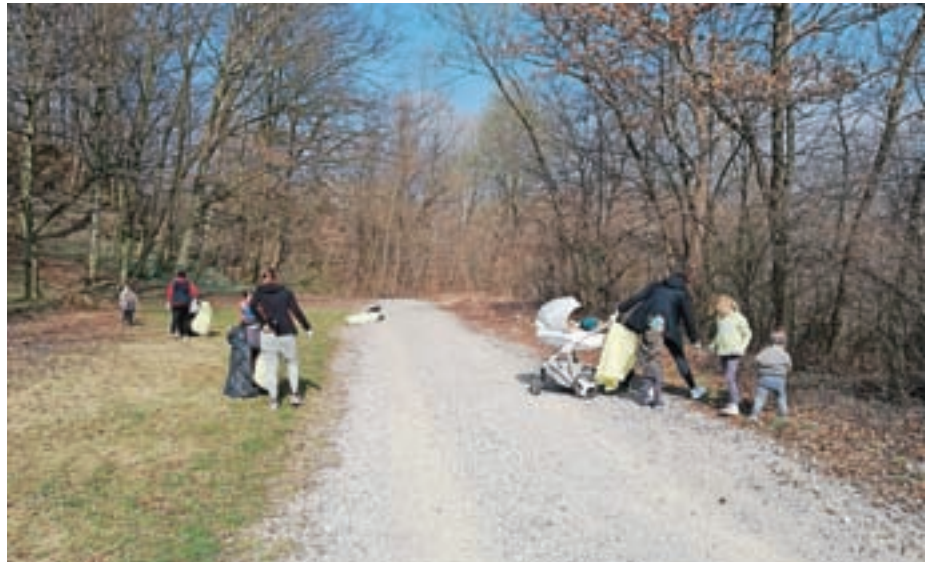
Gremo v akcijo! / Foto: Sandra Kepic

Hvala vsem, ki se čistilnih akcij udeležite! Veseli bomo vsakega novega udeleženca. Urša Korošec