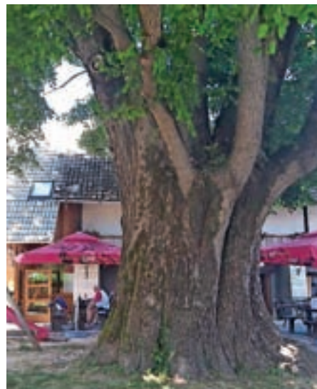
Kočka lipa, senca brez primere

Ja, to je pa pot, ki jo je treba prehoditi po »Partizanki«. Najin nasvet: hodite po levi. Če se kdaj odpravite po njej, boste vedeli, zakaj. V glavnem: dolg klanec, vsaj 15 km, sploh se ne neha. In končno – prelaz Brezovica, Bela krajina, hvala bogu, zdaj pa samo še dol proti Črnomlju. A glej