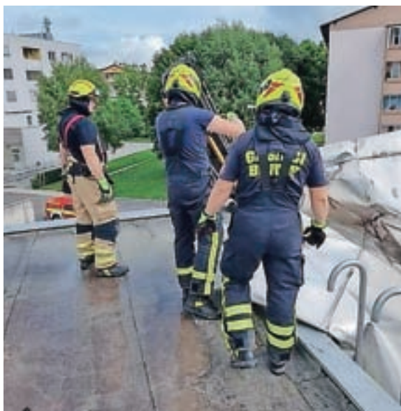
Na pomoč na intervenciji