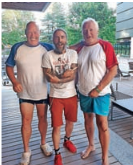
Zabava v Dolenjskih Toplicah

Prejšnji večer sva se pogovarjala, ali nama je res treba vsak dan prehoditi petdeset kilome-