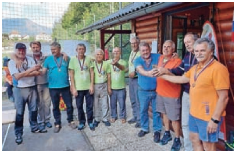
Prvenstvo društev upokojencev v prstometu 2021 v organizaciji ŠD Rokce