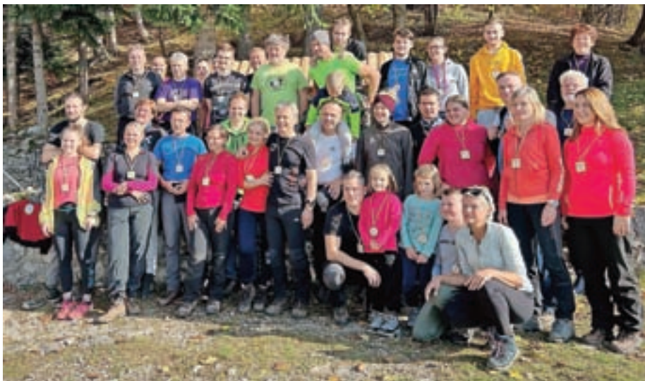
Vzdušje je bilo odlično.