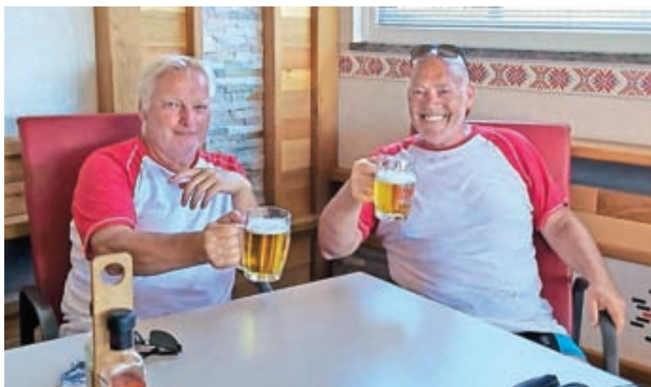
Cilj pri Pavliču v Vinici

Priporočava: dobro karto (midva je nisva imela); obilo tekočine (to sva imela); da ne sprašujete kvazidomačinov po bližnjicah; med hojo ob Krki ne pričakujte, da se boste namakali na vsakem vogalu; primerno obutev; ne pretežek nahrbtnik; potrpljenje, sploh če niste sami, in obilo dobre volje. Spisal: Janez Čimžar