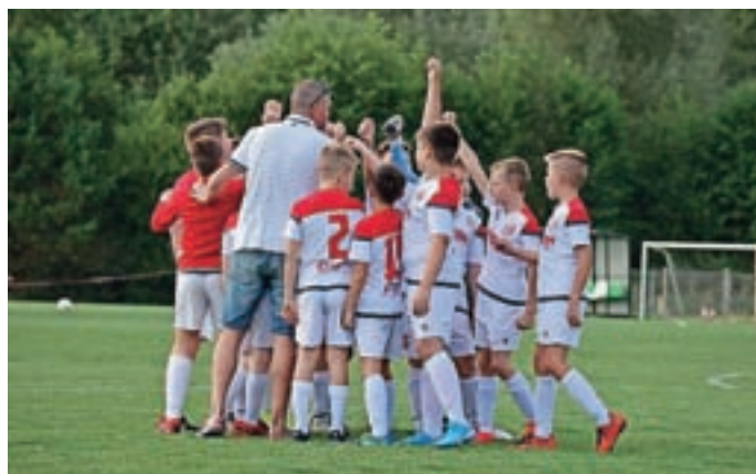
Število otrok iz meseca v mesec raste, kar nam govori, da na igrišču delamo dobro.

Že dolgo je v Nogometnem klubu Britof prisotna želja po širitvi nogometnega igrišča, da bi ustrezalo standardom Nogometne zveze Slovenije in bi na njem lahko igrali najmočnejše Slovenske nogometne lige, zato se že snujejo ideje, kako to izvesti. Namen Nogometnega kluba Britof je, da se v bližnji prihodnosti na zemljišču, kjer je bila žaga Čop in je v lasti Nogometnega kluba Britof, zgradijo prostori z novimi garderobami,