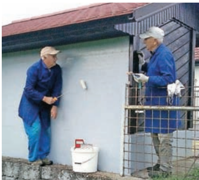
Obnova avtobusnih postajališč

Ravno tako pa bi se svetniki KS Britof zahvalili vseh društvom in klubom, ki delujejo v naši krajevni skupnosti. V veselje nam je, da v tako