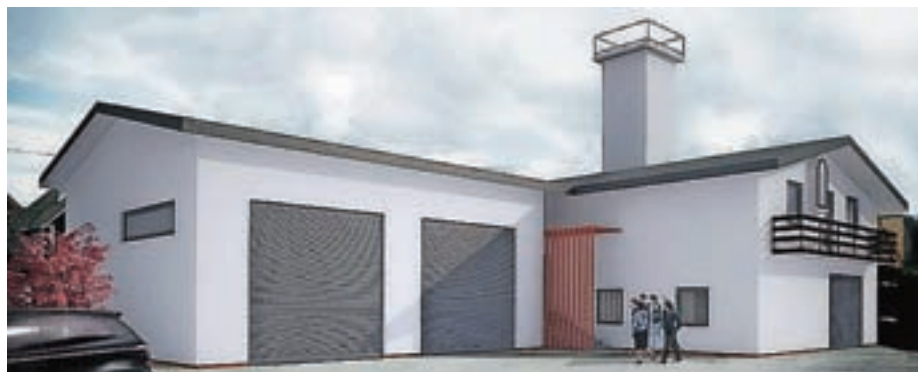
Cilj, da gasilski dom dobi novo podobo in nov prizidek z garažo

Z željo, da gasilski dom dobi novo podobo in nov prizidek z garažo, so se lotili legalizacije objekta, ki je bila zelo zahtevna. Legalizacija objekta je pri koncu in so že vložili vlogo za pri-