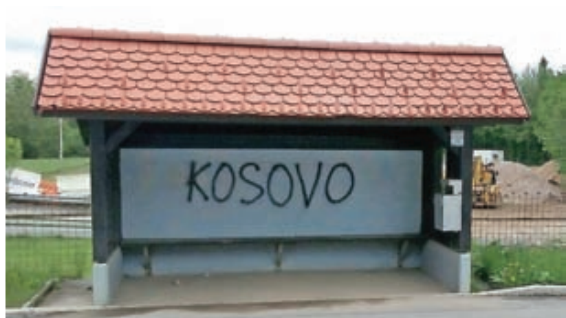
V maju so nas presenetili neprimerni napisi na avtobusnih postajališčih ...