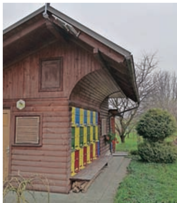
Solarna čebelarška tehtnica z vremensko postajo na Kokrici